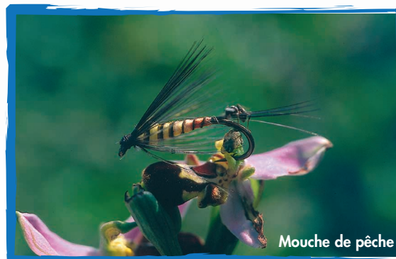
Mouche de pêche