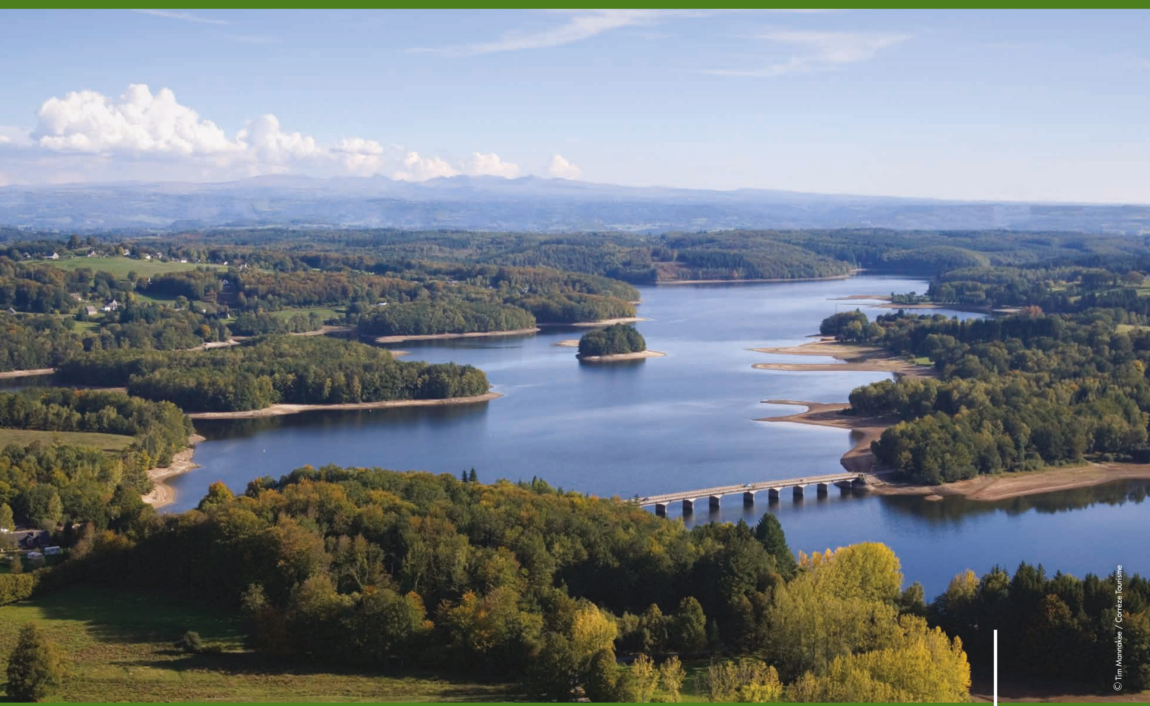
Lac de la Triouzoune