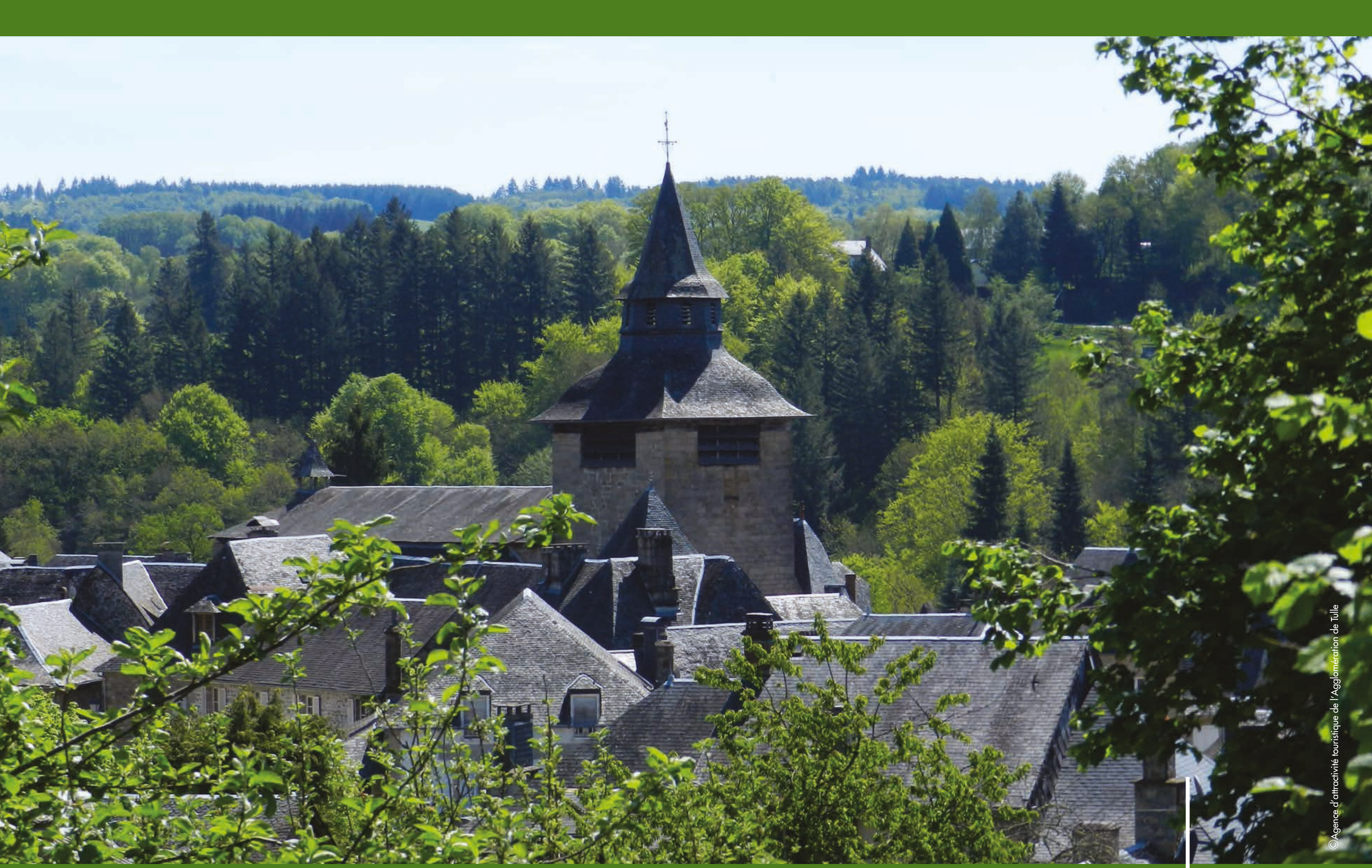
Bourg Médiéval de Corrèze