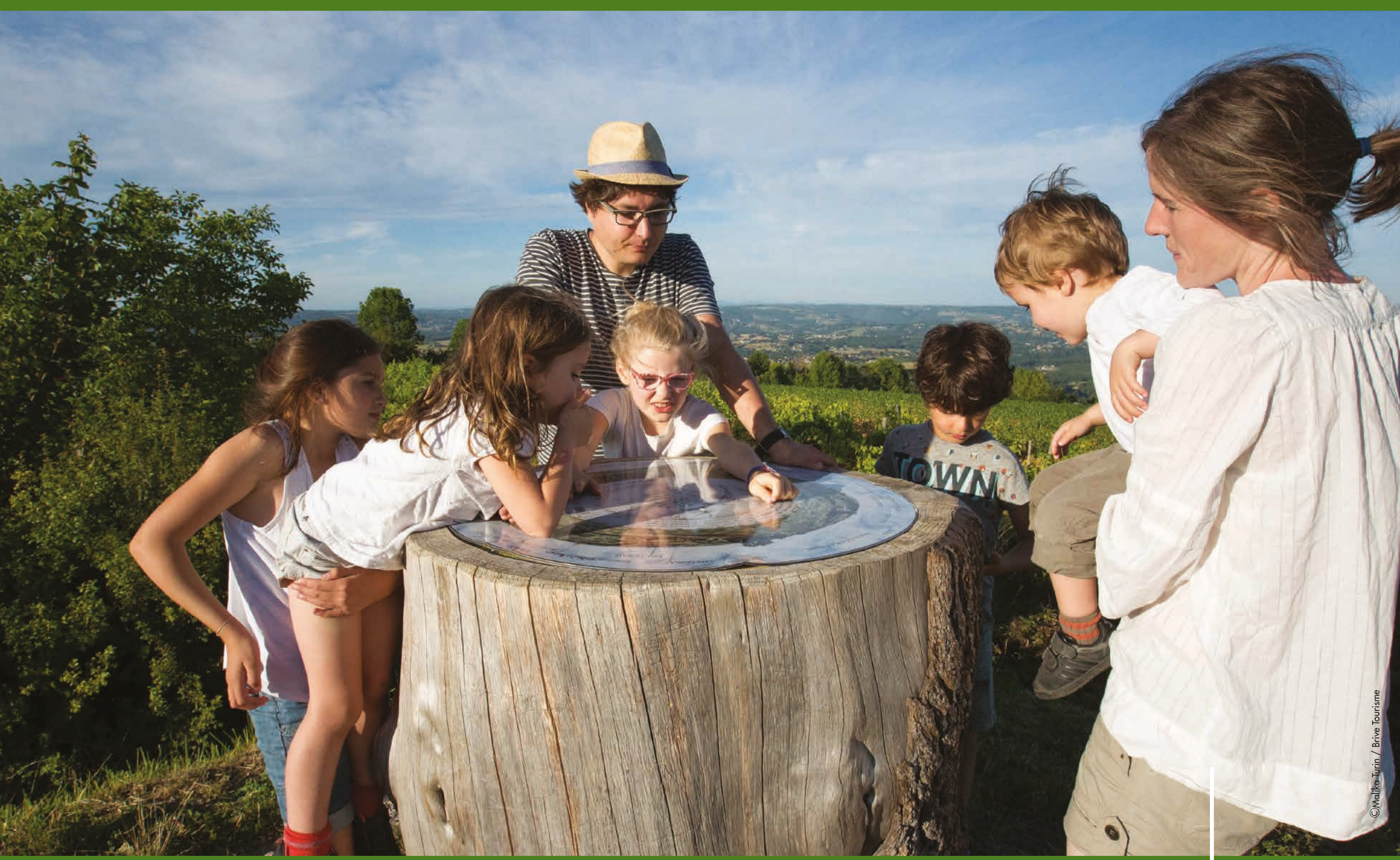
Table d'orientation du Puy d'Yssandon