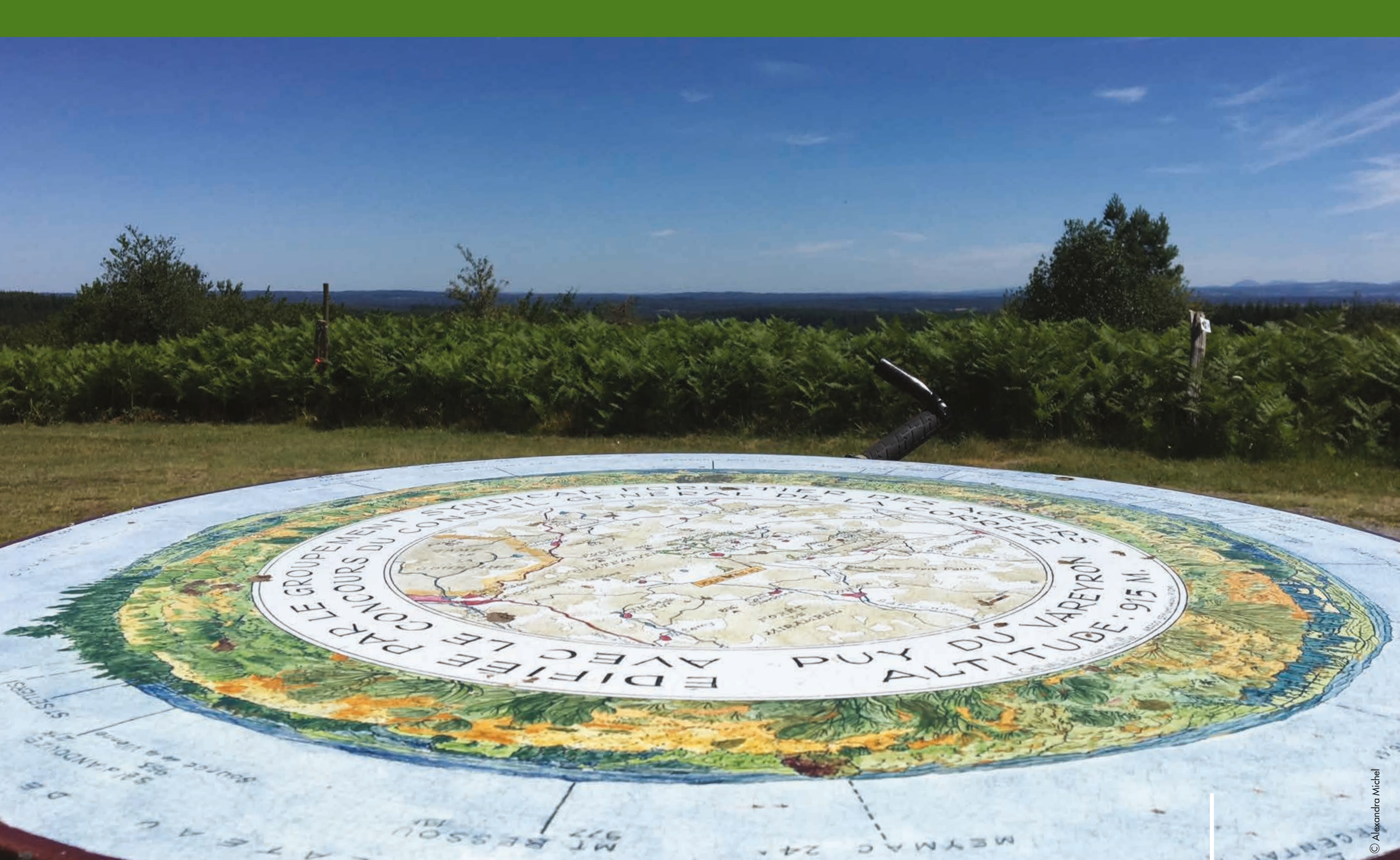
Puy du Vareyron